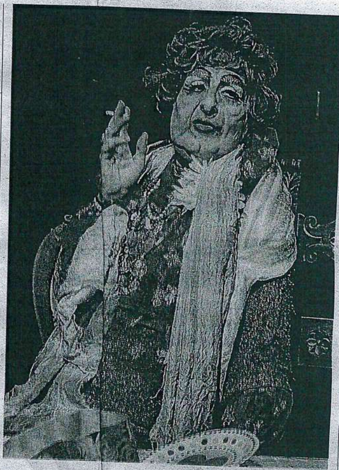
Una scena di "Bruna, per carità"

La formula è quella consolidata: canzoni sconosciute al grande pubblico ma potenti, musiche fuori dai circuiti ufficiali degne di essere ascoltate e rivalutate per la loro carica poetica; racconti di vita vissuta, barzellette, battutacce, il tutto nella verace natura del fiorentino popolare ma sincero. I biglietti sono disponibili sul sito del teatro, Teatro di Fiesole.it, su Ticketone.it (tel. 892 101) e nei punti Box Office Toscana. Il costo del tagliando, escluso i diritti di pre-